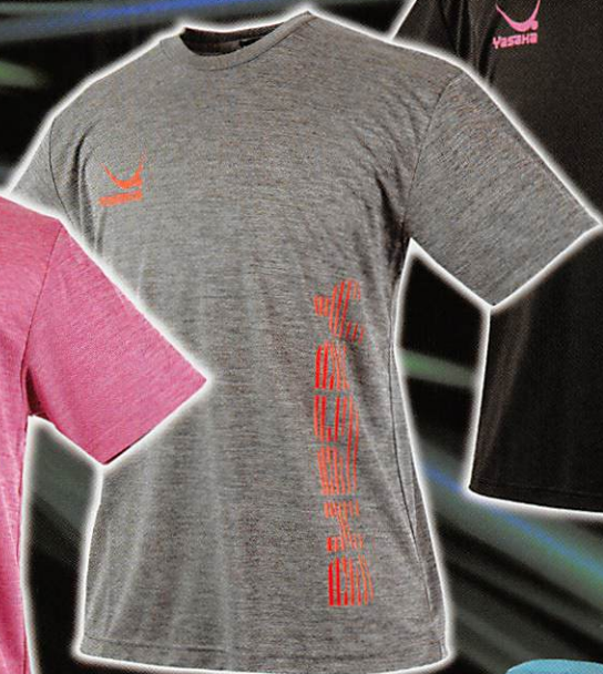
ヘザーチャコール